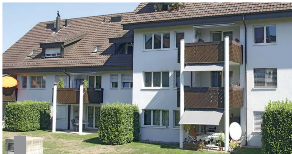
Eine offene Terrasse vor der Eigentumswohnung ist besonders im Sommer ein Gewinn an Lebensqualität und eignet sich prima für Aktivitäten im Freien.

Die Fläche der Terrasse zu erweitern, zu befestigen und gegen Blicke abzuschirmen ist ein nachvollziehbarer Wunsch der Wohnungseigentümer, die daran Sondernutzungsrechte haben. Eine Eigentümergemeinschaft hatte diesem Anliegen zugestimmt und beschlossen, dass die Kosten der Baumaßnahmen und künftigen Instandhaltung von den Nutzern zu tragen sind. So stand es auch bereits in der Teilungserklärung.